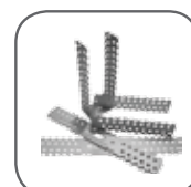
Bügel und Winkel