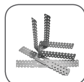
Bügel und Winkel